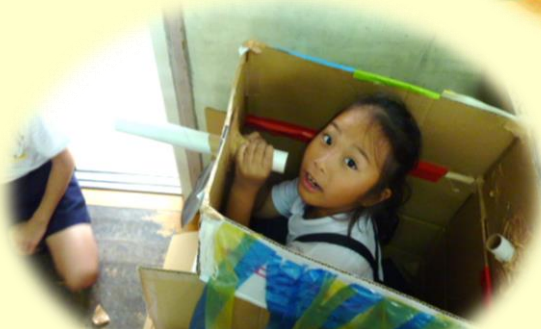
3年図工 アイデアが次々と・・・