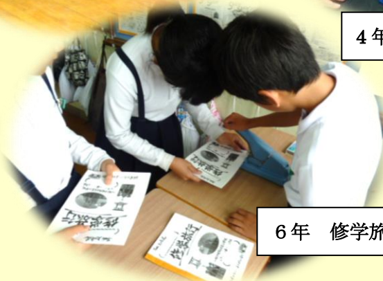
6年 修学旅行のしおり完成！