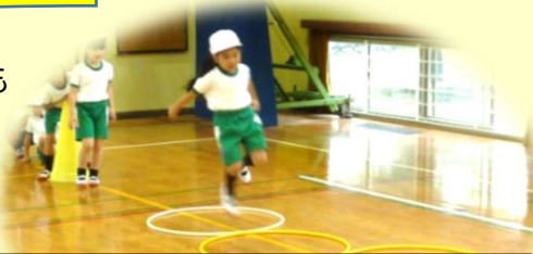
1年 リズミカルにけんけんぱっ！

梅雨空が続きますが、子どもたちは元気に、そして探究心旺盛に学習に取り組んでいます。今週の授業風景から、その『瞬間』を紹介します。